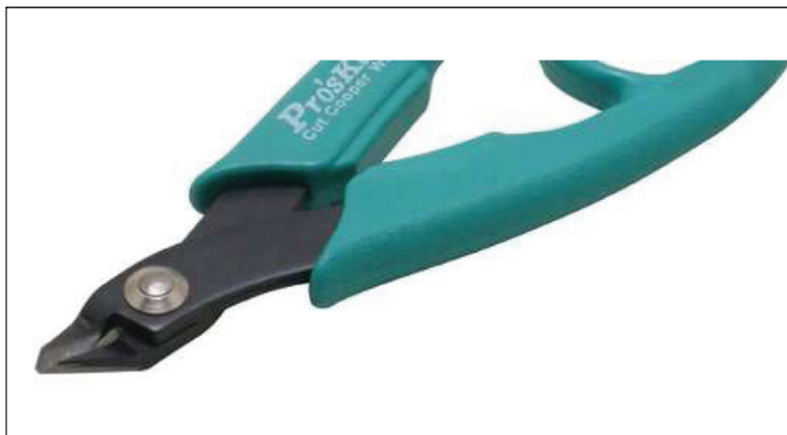
Бокорезы 8PK-101D (PA-101) миниатюрные 130мм, для меди до 1.3 мм