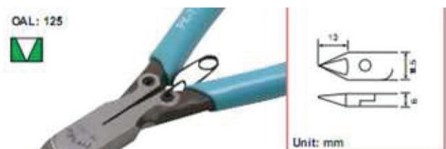
Бокорезы 1PK-717 из углеродистой стали, 125мм, толщина 6мм, для провода до 1.25мм