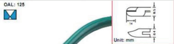
Бокорезы 1PK-5101CE 125мм, крепление внахлест, грани губок под углом 20°, для провода диаметром до 2мм